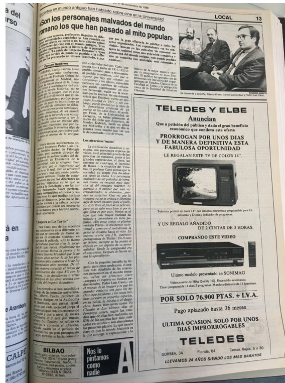
Noticia del Seminario en El Correo